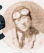
R SEXÉ REPORTER